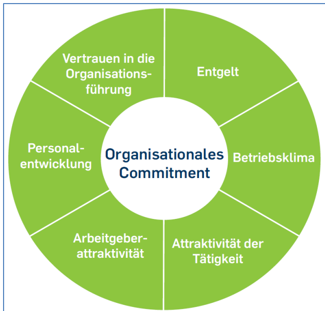
Abbildung 3: Inhaltsbereiche des Bochumer Commitment Inventars (BOCOIN).

Die sechs Indikatoren werden mit jeweils acht Aussagen (Items) erfasst. Das organisationale Commitment wird mithilfe zweier Globalitems gemessen, sodass der Fragebogen insgesamt 50 Aussagen enthält. Eine Aussage zum Entgelt lautet beispielsweise: „Mein Gehalt ermöglicht mir den Lebensstandard, den ich mir wünsche.“ Die Aussagen werden auf einer Skala von 1 („trifft voll zu“) bis 6 („trifft überhaupt nicht zu“) eingeschätzt.